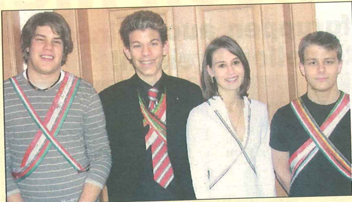
Neuer Vorstand im Jugendbereich des VMCC/VLV.