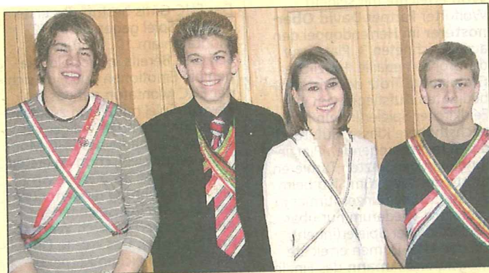
Der neue Vorstand im Jugendbereich.