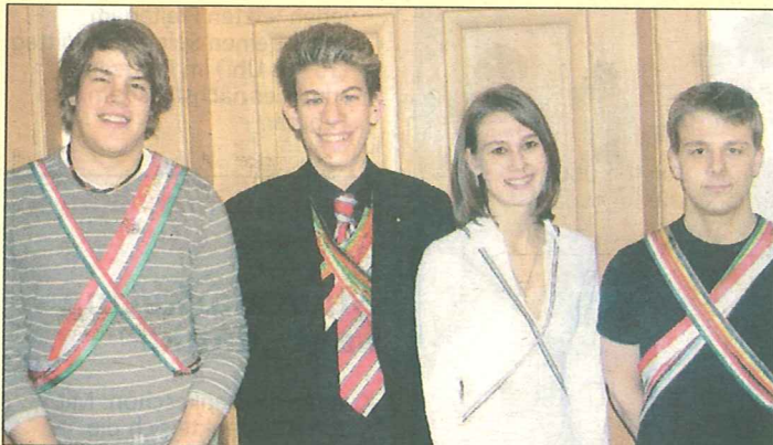
Neuer Vorstand im Jugendbereich des VMCC/VLV.