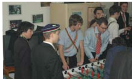
Kartellbrüder der Augia sind regelmäßig auf der Kustersbergbude anzutreffen - und auch umgekehrt.