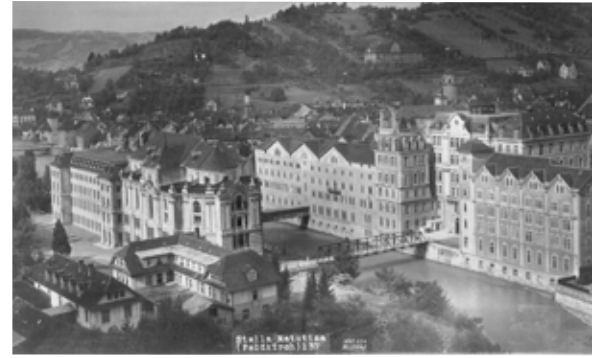
Stella Matutina © Stadtarchiv Feldkirch

Mich persönlich hatten der Anschluss und das ganze Nazigebahren dermaßen betroffen gemacht und ich hatte eine solche Wut im Bauch, dass ich es im Kolleg nicht mehr aushielt. Und weil das frühere oder spätere Ende der Privatschulen in Österreich abzusehen war, wollte ich noch vor Ostern in die Schweiz zurück. Da die älteren Schüler inzwischen zum Teil Liechtensteiner Grenze spazieren konnten, gab ich meinem Bruder, der damals in die 6. Klasse ging, einen Brief an meine Eltern mit, dass ich es in Feldkirch nicht mehr aushalte und nach Hause wolle. So kam