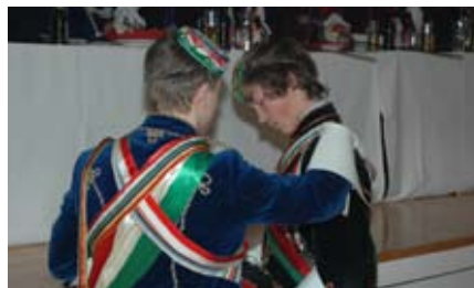
Die Senioren der beiden Verbindungen tauschen die Bänder.