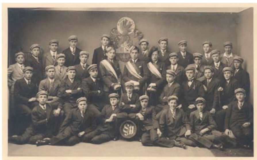
Aktivitas der KMV Clunia 1933/34

09:30 Uhr Besuch der Messe im Dom zu St. Nikolaus mit anschließender Wanderung durch die Schmiedgasse (Gründungshaus CLF) - Kehr – Margarethenkapf – Illdamm – St. Wolfgang – St. Corneli (mit der Gründung des Hainbundes 1907 nahm Clunia hier ihren Ausgang). Anschließend Mittagessen und gemütlicher Ausklang.