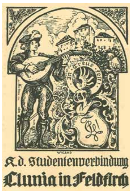
Couleurkarte der Clunia, die bis 1924 in Verwendung war.

1928 entstand mit Unterstützung der „Lehrerverbindung“ Amelungia Innsbruck und des TMV am Lehrerseminar Feldkirch eine Markomania, die ihren Betrieb ohne Wissen der Internatsleitung im Verborgenen führt und zu den anderen Vorarlber-