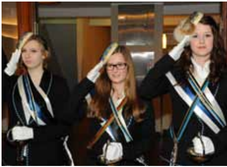
Bregancea (Stiftungsfest 2012)