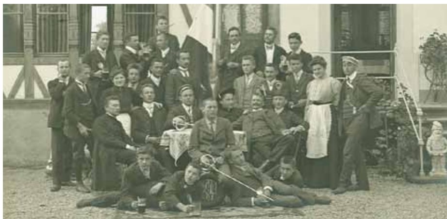
Stiftungsfestausflug 1908 der Alemannia nach Schruns, Gasthaus „Sternen“.

gesinnten Mittelschüler zu organisieren. Jedes Jahr zu Kaisers Geburtstag (18. August) trafen sich diese launigen Ferialsippnen zu einem „Kaiserkommers“.