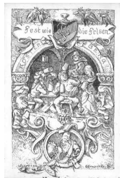
Couleurkarte der Kustersberg von 1919.