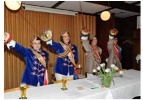
Clunia und Sonnenberg 2012