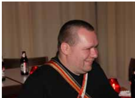
LVV Alexander Waller v/o Ericsson