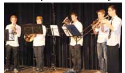
Bläserquintett der Musikschule tonart/Mittleres Rheintal