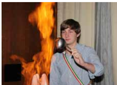
Miraculix' Zündung des Krambambuli - es hat hervorragend geschmeckt.