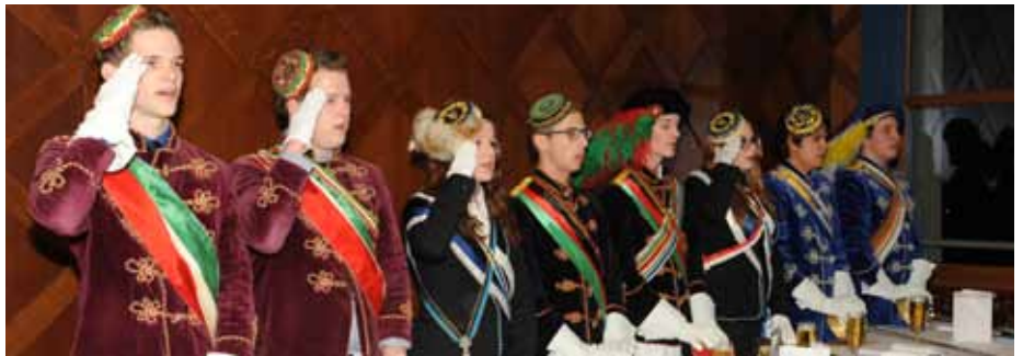
Unterländer Osterkommers 2012 am Gebhardsberg in Bregenz

2012 in den Verband farbentragender Mädchen (VfM) aufgenommen wurde.